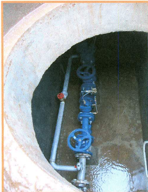
Fotografía N° 9: Válvula reductora de presión inundada