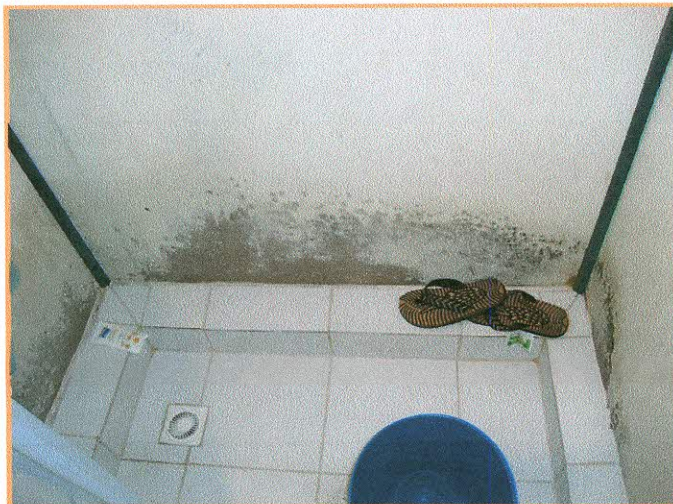
Fotografía N° 1: Caseta N° 320