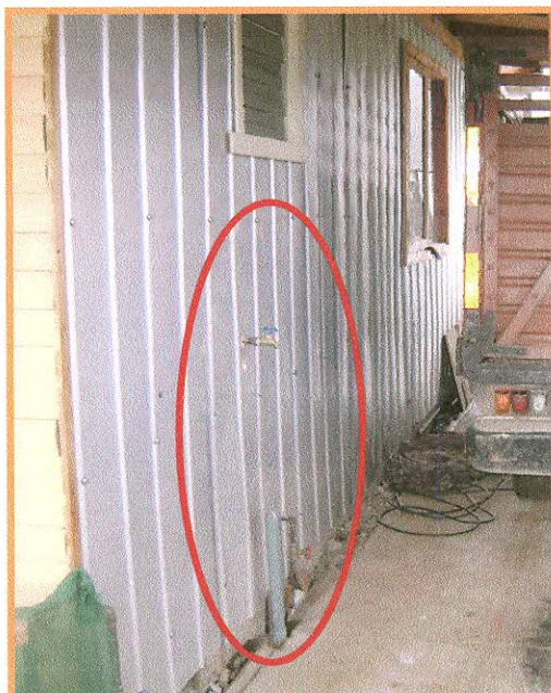
Fotografía N° 5: Caseta N° 111, instalaciones de lavadero