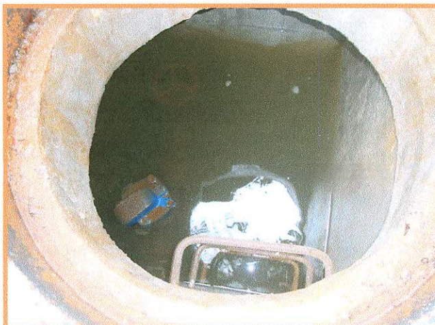
Fotografía N° 6: Válvula con ventosa