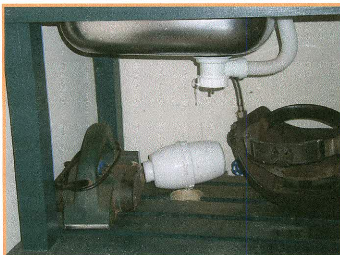
Fotografía N° 2: Caseta N° 320, sifón de lavaplatos desprendido