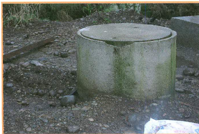
Fotografía N° 4: Caseta N° 118, cámara con su coronamiento quebrado