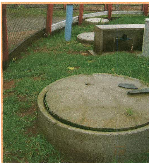
Fotografía N° 3: Caseta N° 511, tapa de cámara fisurada