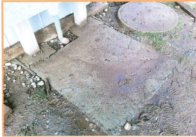
Fotografía N° 10: Caseta N° 213, losa de lavadero fracturada