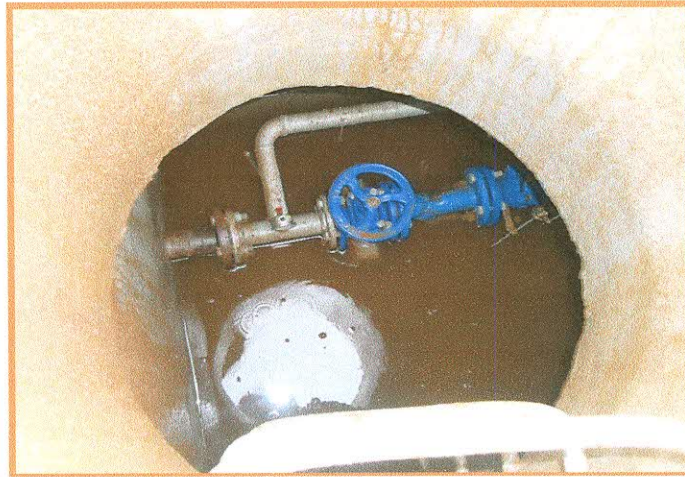
Fotografía N° 7: Válvula reductora de presión inundada