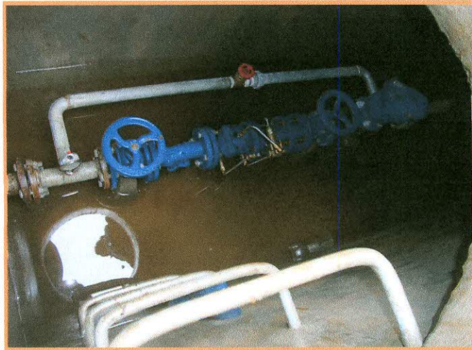
Fotografía N° 8: Válvula reductora de presión inundada