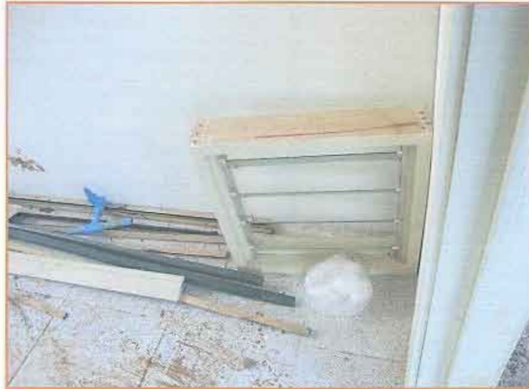
Fotografía N° 17 Caseta beneficiario N° 299F.

Proyecto "Construcción casetas sanitarias en seis sectores rurales de Lanco" "Casetas Sanitarias Sector Puquiñe" (Continuación)