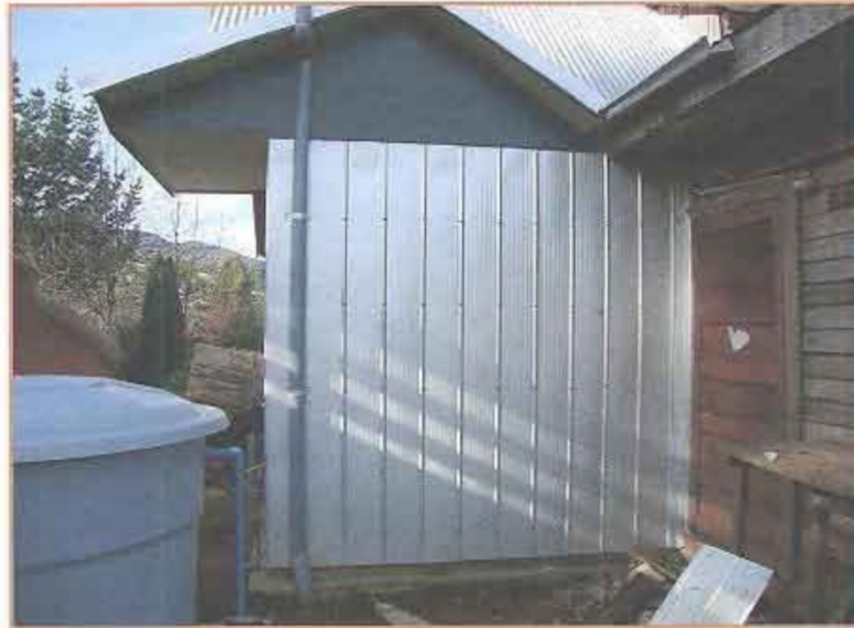
Fotografía N° 5 Beneficiario N° 206 - Rafael Arcangel Calfuleo Puchi.

Proyecto "Construcción casetas sanitarias en seis sectores rurales de Lanco" "Casetas Sanitarias Sector Puquiñe" (Continuación)