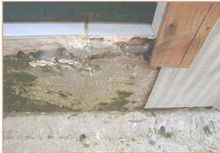
Fotografía N° 10 Irregularidades superficiales y enfierradura a la vista.