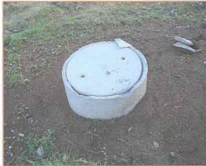
Fotografía N° 11 Cámara con bordes quebrados.

Proyecto "Construcción casetas sanitarias en seis sectores rurales de Lanco" "Casetas Sanitarias Sector Puquiñe" (Continuación)