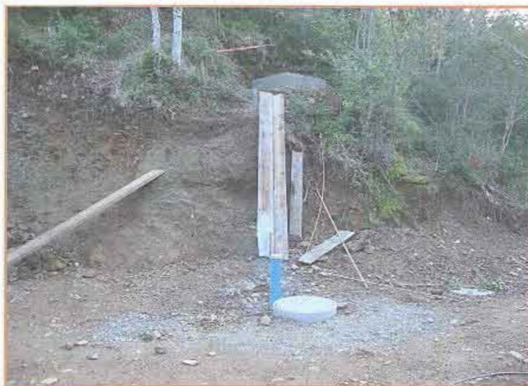
Fotografía N° 18 Caseta beneficiario N° 271.