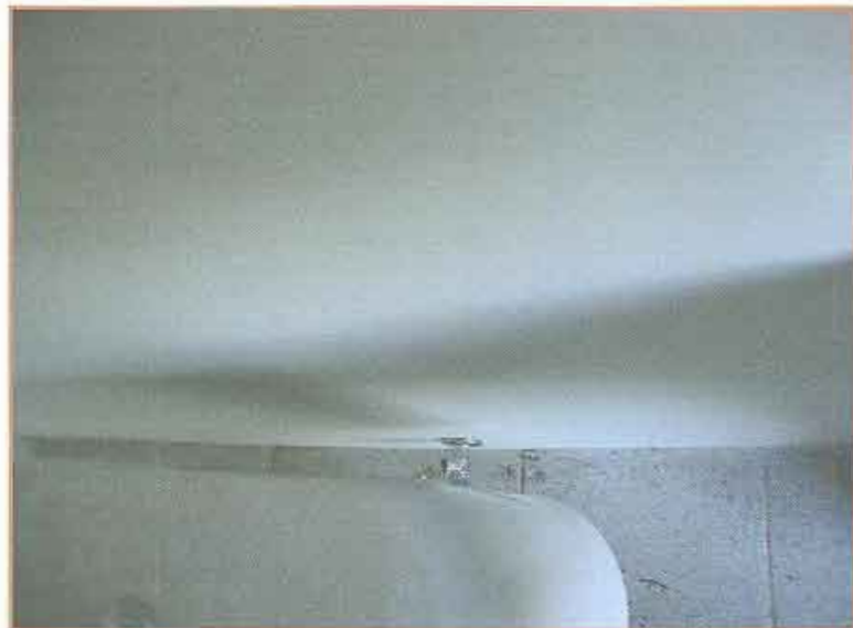
Fotografía N° 14 WC distanciado del muro.