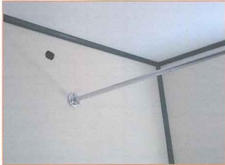
Fotografía N° 13 Revestimiento de fibrocemento perforado.

Proyecto "Construcción casetas sanitarias en seis sectores rurales de Lanco" "Casetas Sanitarias Sector Puquiñe" (Continuación)