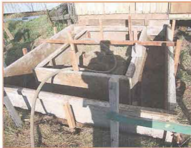
Fotografía N° 16 Caseta beneficiario N° 203.