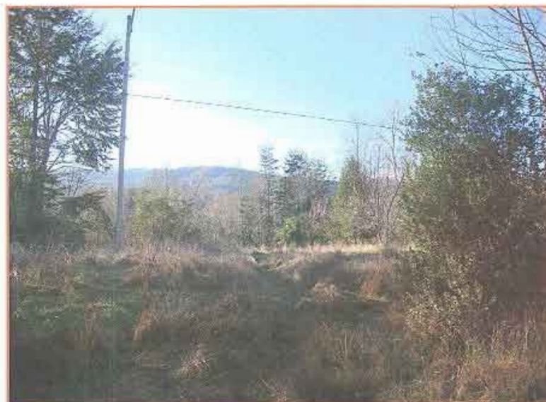
Fotografía N° 2 Beneficiario N° 202 - Eleacer Jaque Aroca Aroca