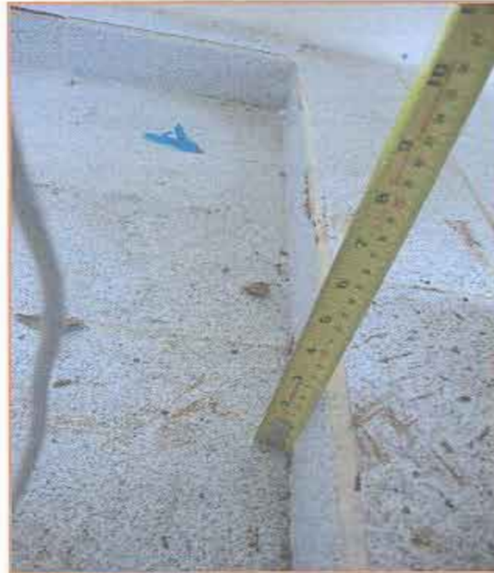
Fotografía N° 15 Receptáculo de ducha.

Proyecto "Construcción casetas sanitarias en seis sectores rurales de Lanco" "Casetas Sanitarias Sector Puquiñe" (Continuación)