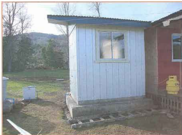
Fotografía N° 4 Beneficiario N° 043 - Iris Manquepillán Huanquil.