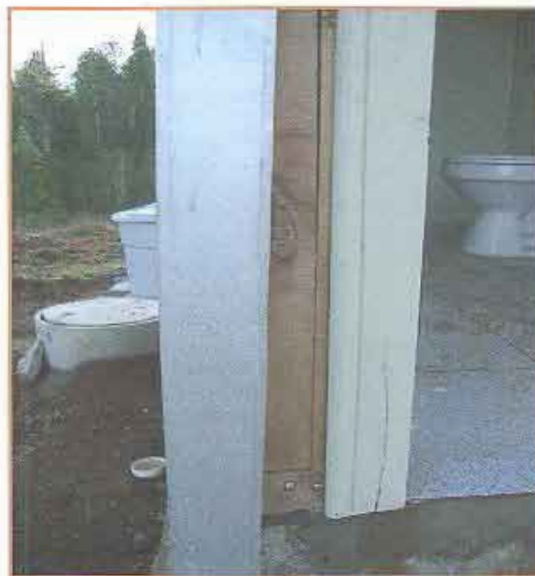
Fotografía N° 12 Plancha de acero zincado removida.