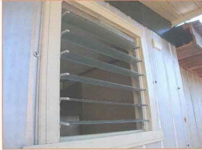
Fotografía N° 7 Celosía de aluminio.

Proyecto "Construcción casetas sanitarias en seis sectores rurales de Lanco" "Casetas Sanitarias Sector Puquiñe" (Continuación)