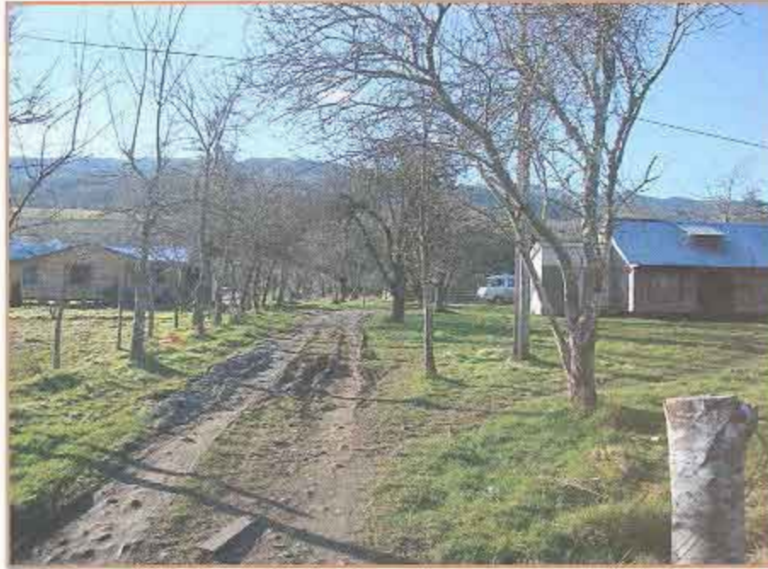
Fotografía N° 3 Beneficiario N° 299F - Juan Carileo Traumaleo.

Proyecto "Construcción casetas sanitarias en seis sectores rurales de Lanco" "Casetas Sanitarias Sector Puquiñe" (Continuación)