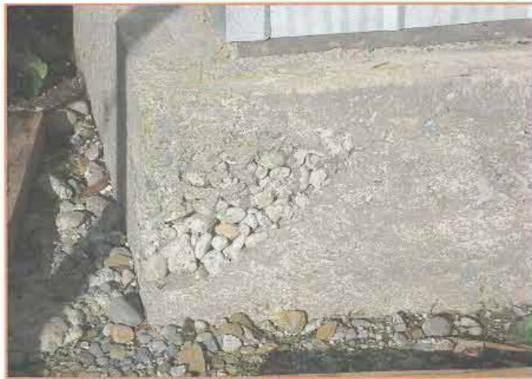
Fotografía N° 8 Cimientos de hormigón con nidos.