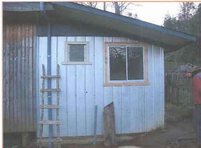
Fotografía N° 6 Beneficiario N° 207 - Daniel Rosamel Calfuleo Puchi.