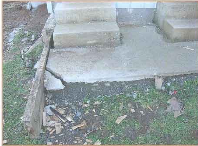
Fotografía N° 9 Radier de hormigón fracturado.

Proyecto "Construcción casetas sanitarias en seis sectores rurales de Lanco" "Casetas Sanitarias Sector Puquiñe" (Continuación)