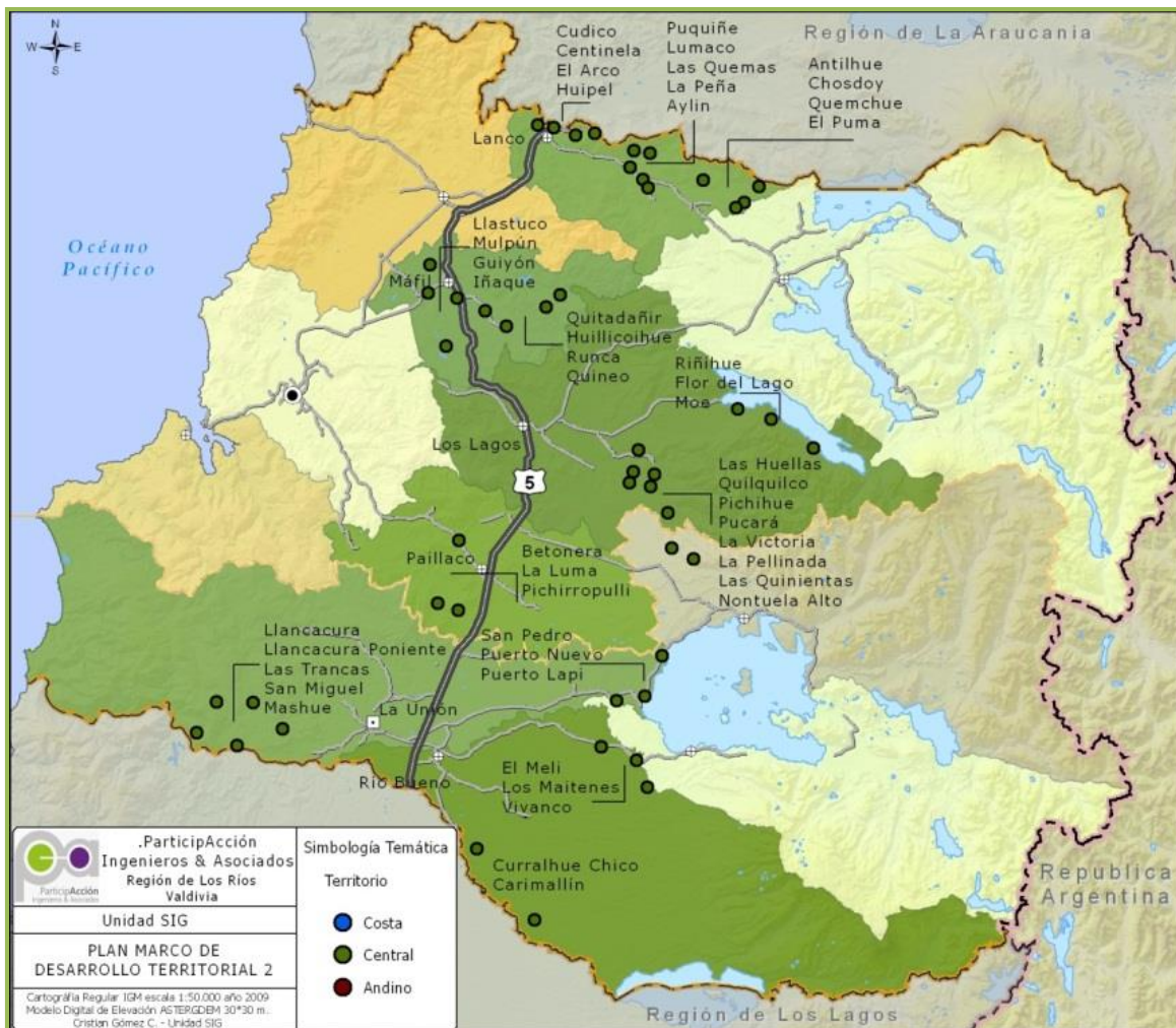
Ilustración 1. Mapa de Ubicación de las Localidades Priorizadas en el PMDT-2, para el Territorio Los Ríos Central.

En el mapa aparecen reflejadas espacialmente las localidades que conforman los diferentes subterritorios incluidos en el Territorio Los Ríos Central.