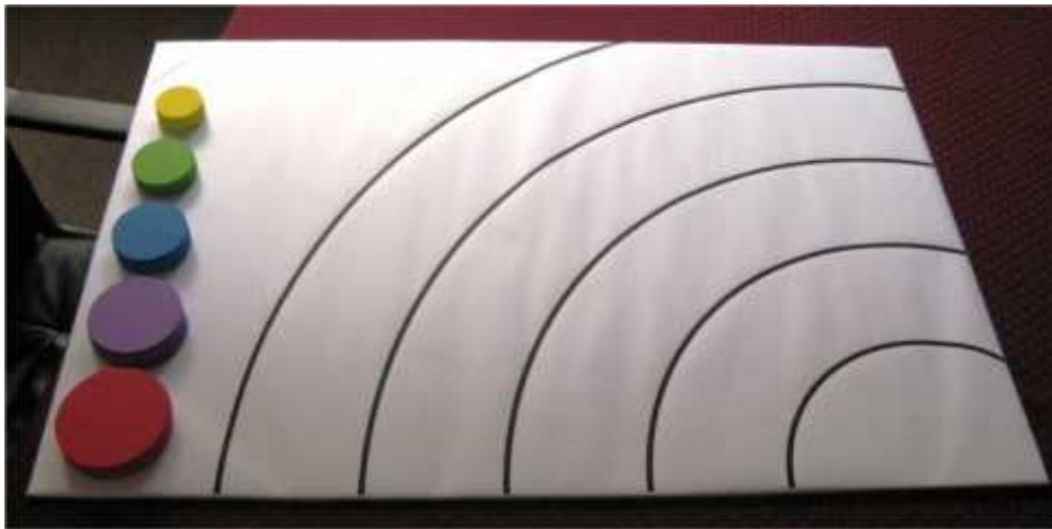
Imagen N° 2: Mapa participativo: interés/poder de organizaciones

Finalmente, el mapa elaborado participativamente será discutido por la consultora en conjunto con la mesa técnica del GORE.